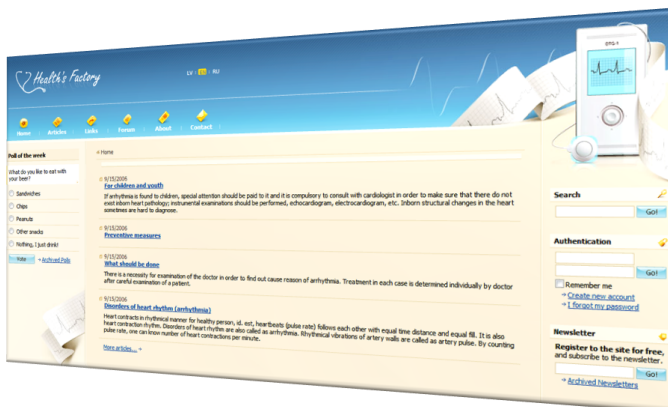
1. att. E-MED. Centrs

SIA Data Pro Grupa ir izstrādājusi Sirds Pasi - sirds veselības monitoringa sistēmu Latvijas bērnu un pusaudžu sirds veselības skrīningam. Mūsu piedāvātais attālinātais pacientu monitoringa risinājums ir radīts, lai būtu iespējams veikt agrīnu sirds un asinsrites sistēmas problēmu diagnostiku. Sirds Pase ietver interneta vidē izvietotu E-MED. centru, programmatūras nodrošinājumu un bezvadu kardiogrāfu (vienkanāla) . Sirds Pase nodrošina pacientu datu pārvaldes sistēmu, kas digitālā veidā uzglabā pacienta dažādu diagnostikas pārbaūžu rezultātus. Tā ir izstrādāta, lai spētu darboties dažādās veselības aprūpes iestādēs, tai skaitā skolu medicīnas kabinetos. Sistēma var nodrošināt darba iespējas uz klēpj datoriem, personīgajiem datoriem, tīkla saslēgumā un šaurās klientu vidēs. Sistēma piedāvā centralizētu failu glabāšanu ( izmantojot MS SQL Servera datubāzes iespējas ).